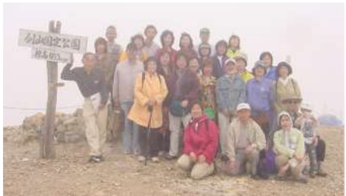
剣山 1955m 登頂の達成感でいっぱい!

整腸法基礎講座(自分のため、家族のため)と検定受験講座(専門家になるため)があります。資料請求等詳しくはエヌエイチアカデミー06-4806-4889にお問ひ合わせください。